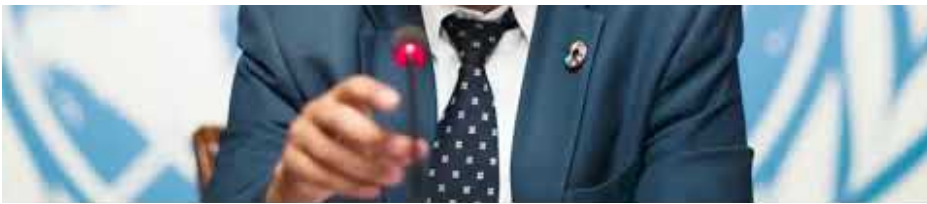
Medical Tyranny 2020